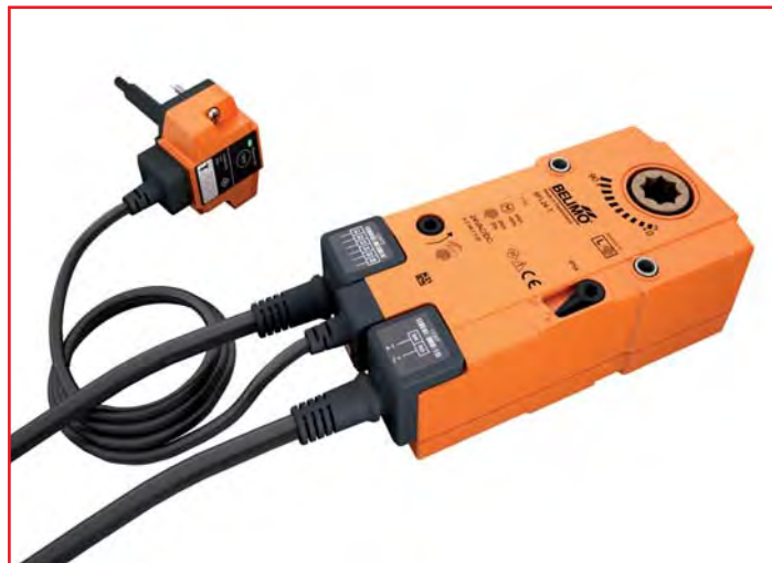
Antrieb BFL mit thermoelektrischer Auslöseeinrichtung BAT

Bei Belimo gibt es in puncto Sicherheit keine Kompromisse. Der Kunde hat die Möglichkeit, Produkte aus einem Sortiment geprüfter Schweizer Qualität auszuwählen und kann sich stets auf lokale, erfahrene Ansprechpartner verlassen. Alles aus einer Hand und zu einem erstklassigen Preis-Leistungs-Verhältnis. ■