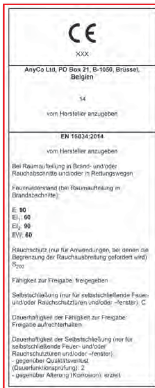
Abbildung 10: Beispiel für eine CE-Kennzeichnung nach EN 16034 (Auszug aus EN 16034)

Zudem sollte der Hersteller ausreichende Anweisungen zum Einbau des Produktes zur Verfügung stellen.