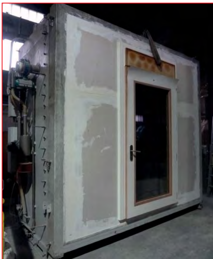
Abbildung 6: verglaste Türe vor der Rauchschutzprüfung