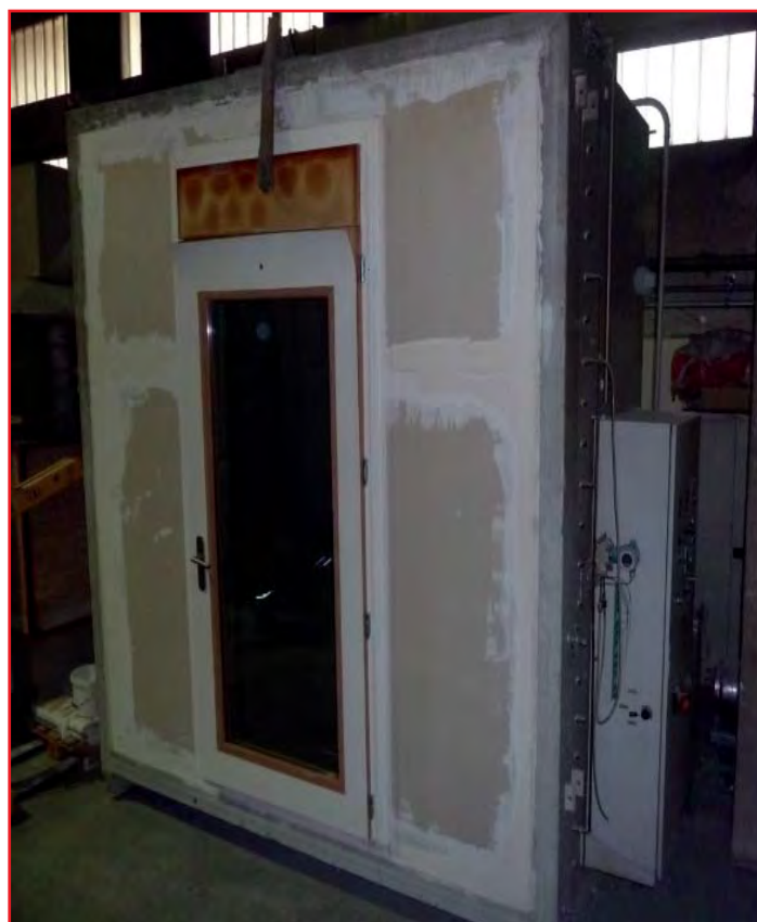
Abbildung 7: verglaste Türe während der Rauchschutzprüfung

Energie oder durch elektrischen Strom, der im Falle eines Stromausfalls durch gespeicherte Energie abgesichert wird. Die Ergebnisse werden nach EN 13501-2 klassifiziert und als „C“ angegeben. Abhängig von der Nutzungskategorie, die anhand der Anzahl der durchgeführten Zyklen bestimmt wird, darf die Klassifizierung durch eine Zahl von 0 bis 5 ergänzt werden.