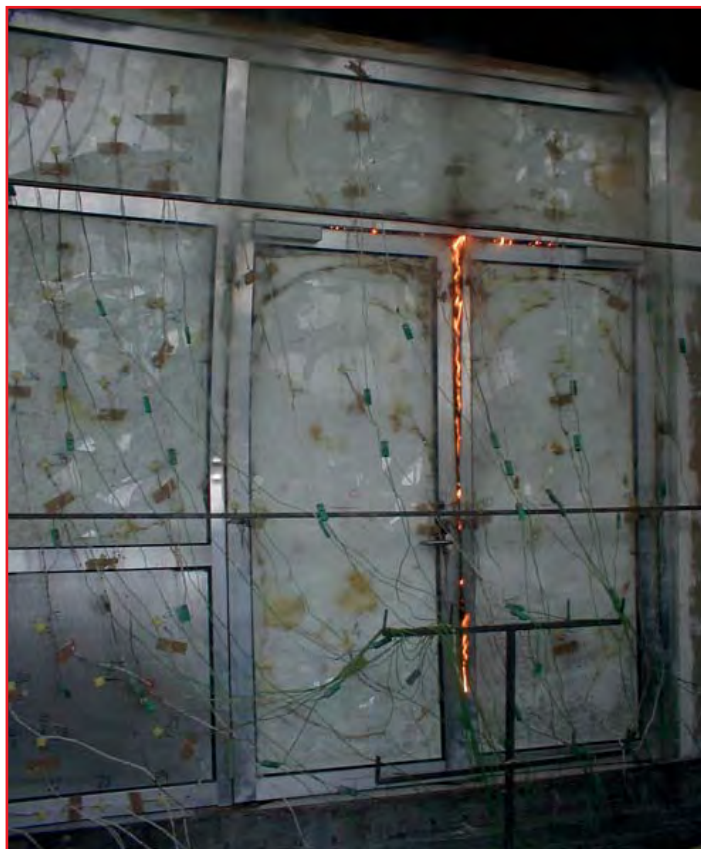
Abbildung 4: verglaste Türe mit Seiten- und Oberteilen zum Ende der Feuerwiderstandsprüfung