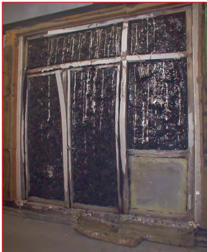
Abbildung 5: verglaste Türe mit Seiten- und Oberteilen nach der Feuerwiderstandsprüfung – brandraumseitige Ansicht