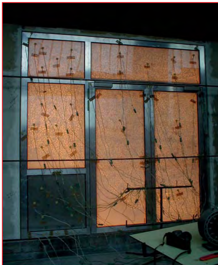
Abbildung 3: verglaste Türe mit Seiten- und Oberteilen während der Feuerwiderstandsprüfung