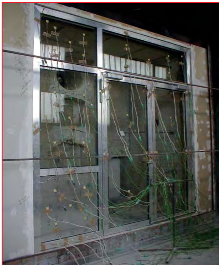
Abbildung 2: verglaste Türe mit Seiten- und Oberteilen vor der Feuerwiderstandsprüfung